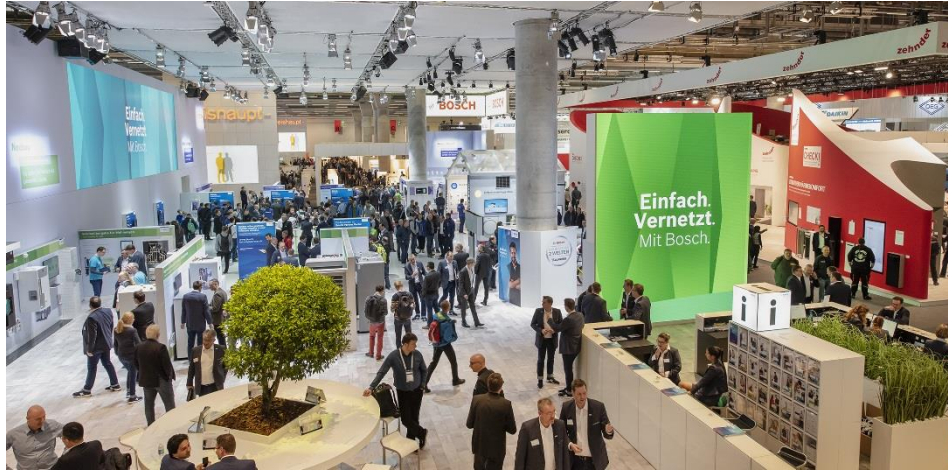
據權威性調查表明，97%的觀眾對於本屆 ISH 2019 表示滿意。

據悉，本屆展會位列前十位的海外觀眾客源國分別為：中國，意大利，荷蘭，法國，瑞士，英國，波蘭，比利時，奧地利和捷克共和國。行業技術和安裝技術板塊吸引的觀眾人數最多。據市場研究統計，本屆 ISH 的觀眾整體滿意度高達 97%。